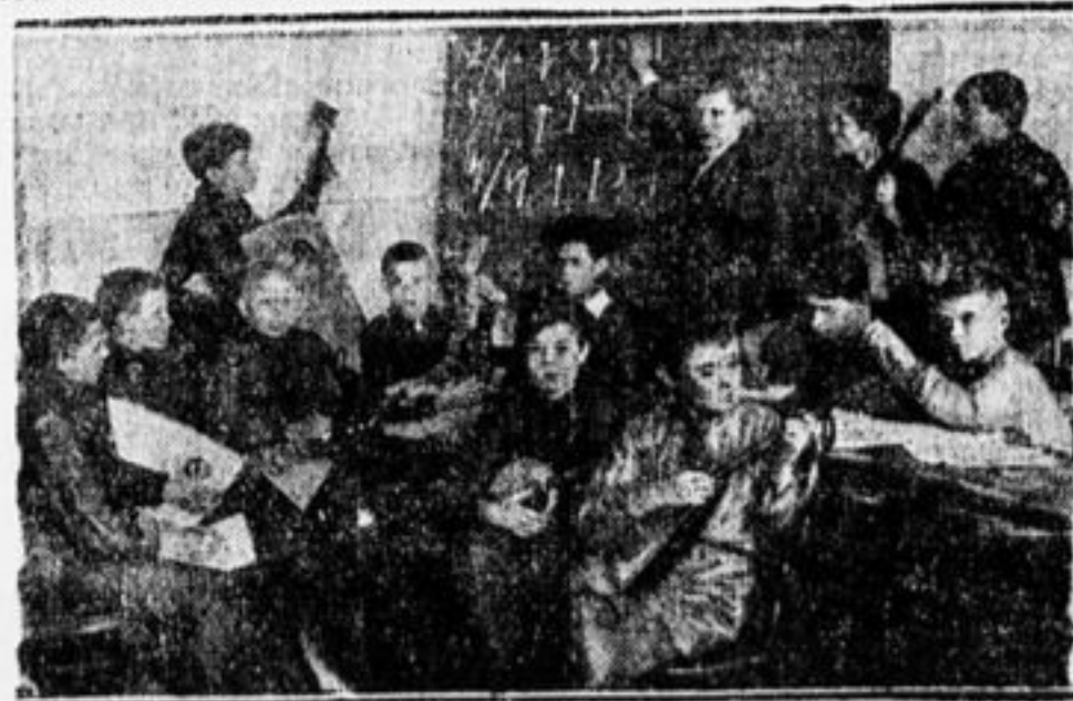
Струнный оркестр путяловцев (Ленинград).