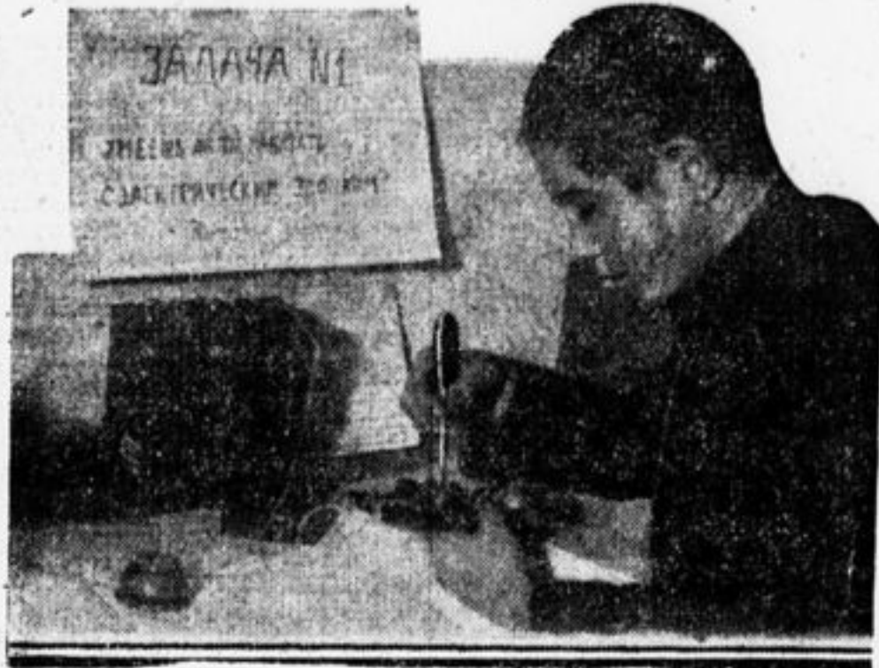
На центральной детской тех. станции.