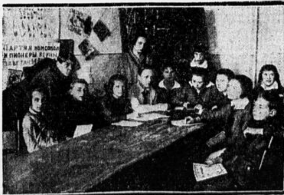
Совет базы «Красного Путиловца» за работой.